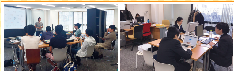
企業見学会(事業説明・若手社員の話等) ※上記写真はイメージです