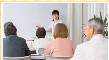
事前オリエンテーション ※会場同上

事業内容: ホテル業・料理飲食業・不動産の賃貸及び管理業・駐車場業 詳しくはHPをご覧ください。https://edmont.metropolitan.jp/