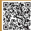
イベントカレンダー

各イベントの詳細及び会場に ついてはヤングコーナー スペシャルサイトを ご確認ください。